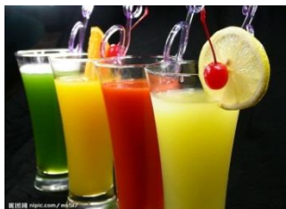
果汁 guǒ zhī