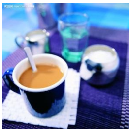
咖啡 kā fēi