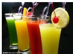
果汁 guǒ zhī