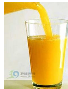
橙汁 chéng zhī