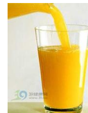
橙汁 chéng zhī