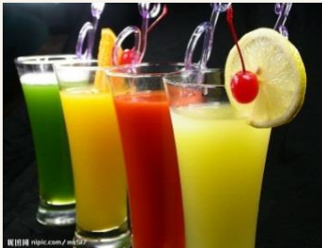
果汁 guǒ zhī