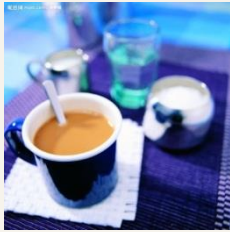
咖啡 kā fēi