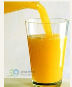
果汁 guǒ zhī