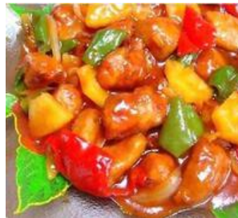
甜酸鸡(tián suān jī)