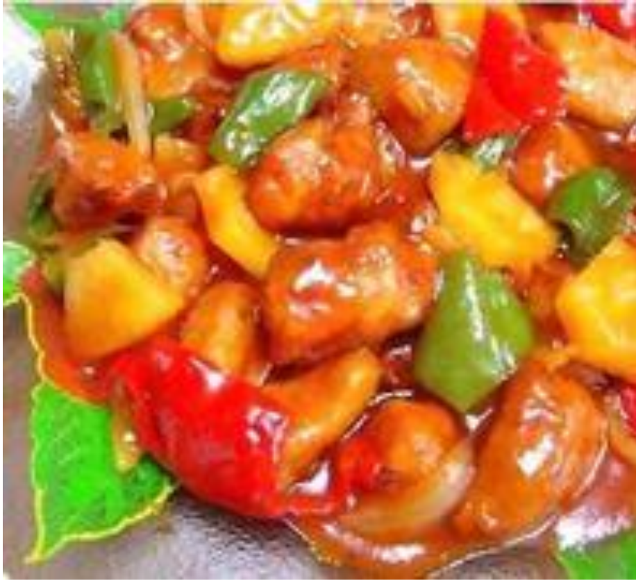
甜酸鸡 (tián suān jī)