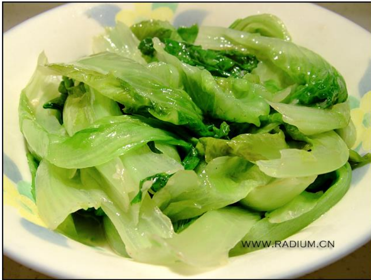
青菜 (qīng cài)