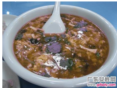
酸辣汤(suān là tāng)