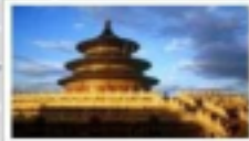
Temple of Heaven