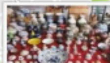
Panjiayuan Antiques Market