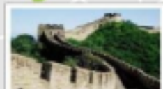
The Badaling Great Wall