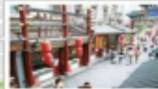
Wangfujing Shopping Street