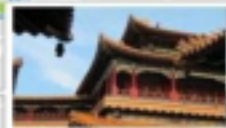
Yonghe Lama Temple